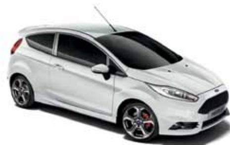
Lakier zwykły Frozen White