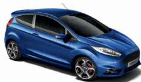
Lakier metalizowany Performance Blue