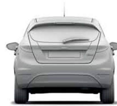
Szerokość bez lusterek: 1722 mm