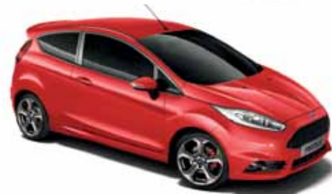
Lakier zwykły Race Red