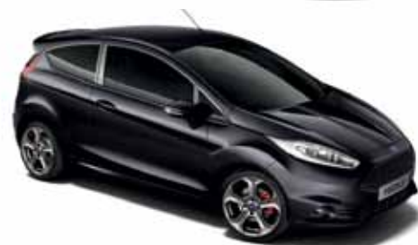
Lakier specjalny Mica Shadow Black