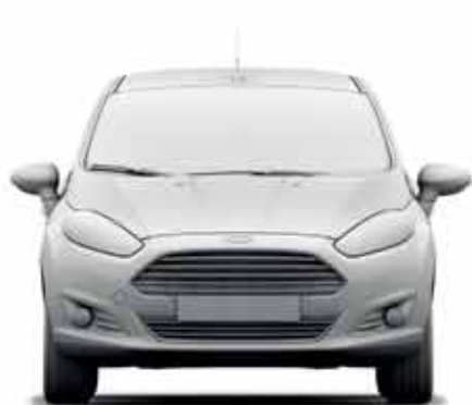
Szerokość z lusterkami: 1978 mm