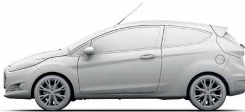
Długość całkowita: 3982 mm