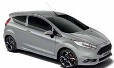
Lakier specjalny Storm Grey